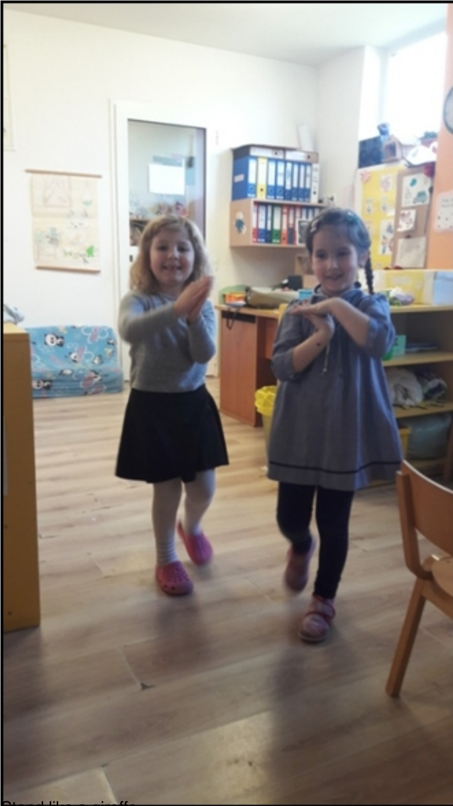
Stand like a giraffe