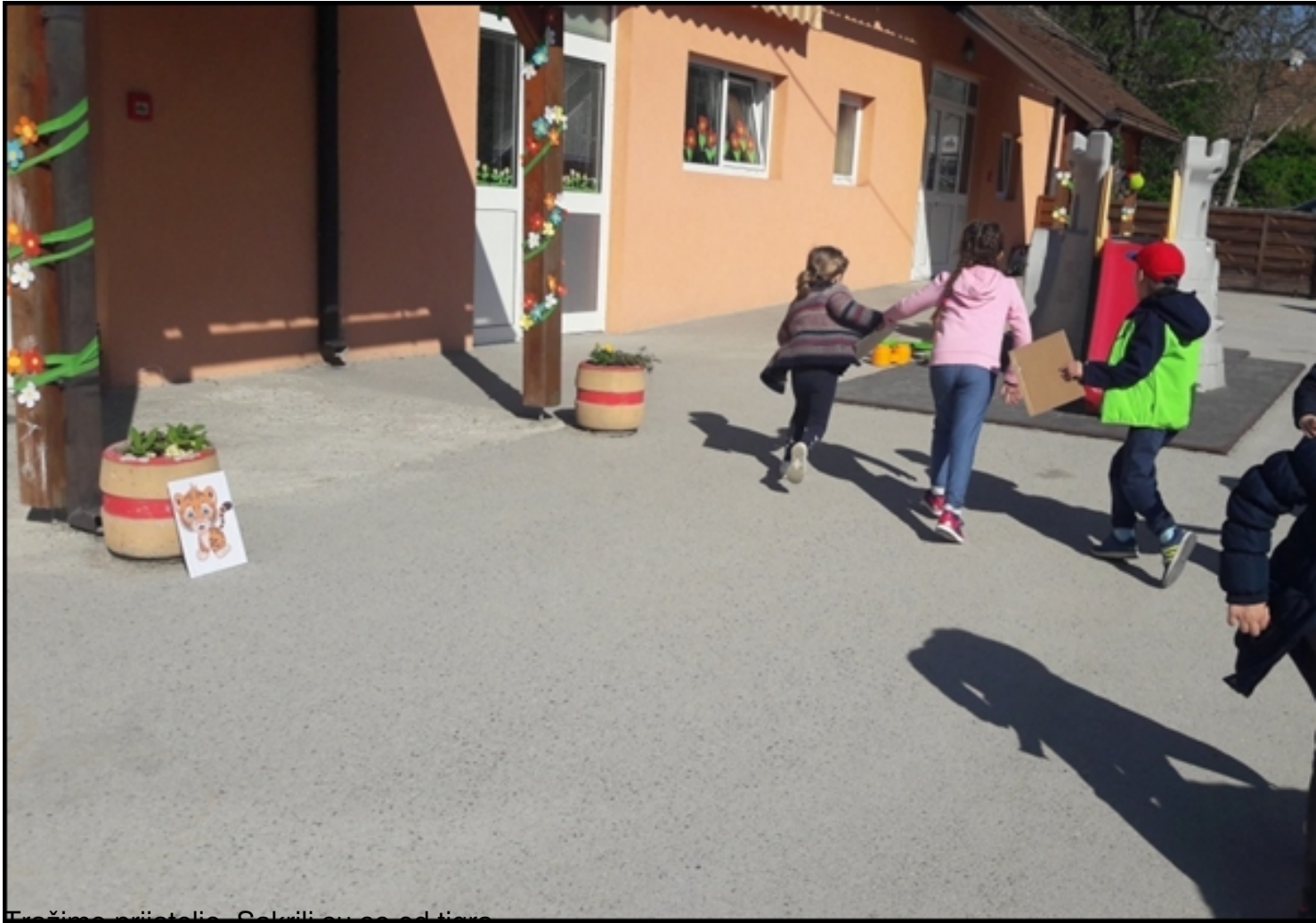
Fražimo prijatelje. Sakrili su se od tigra...