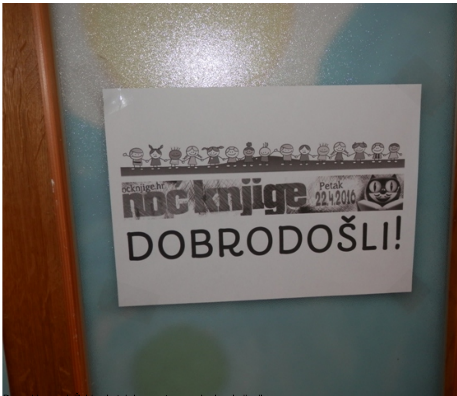
Dnevni boravak Žabica je taj dan postao pravi raj za knjigoljupce.