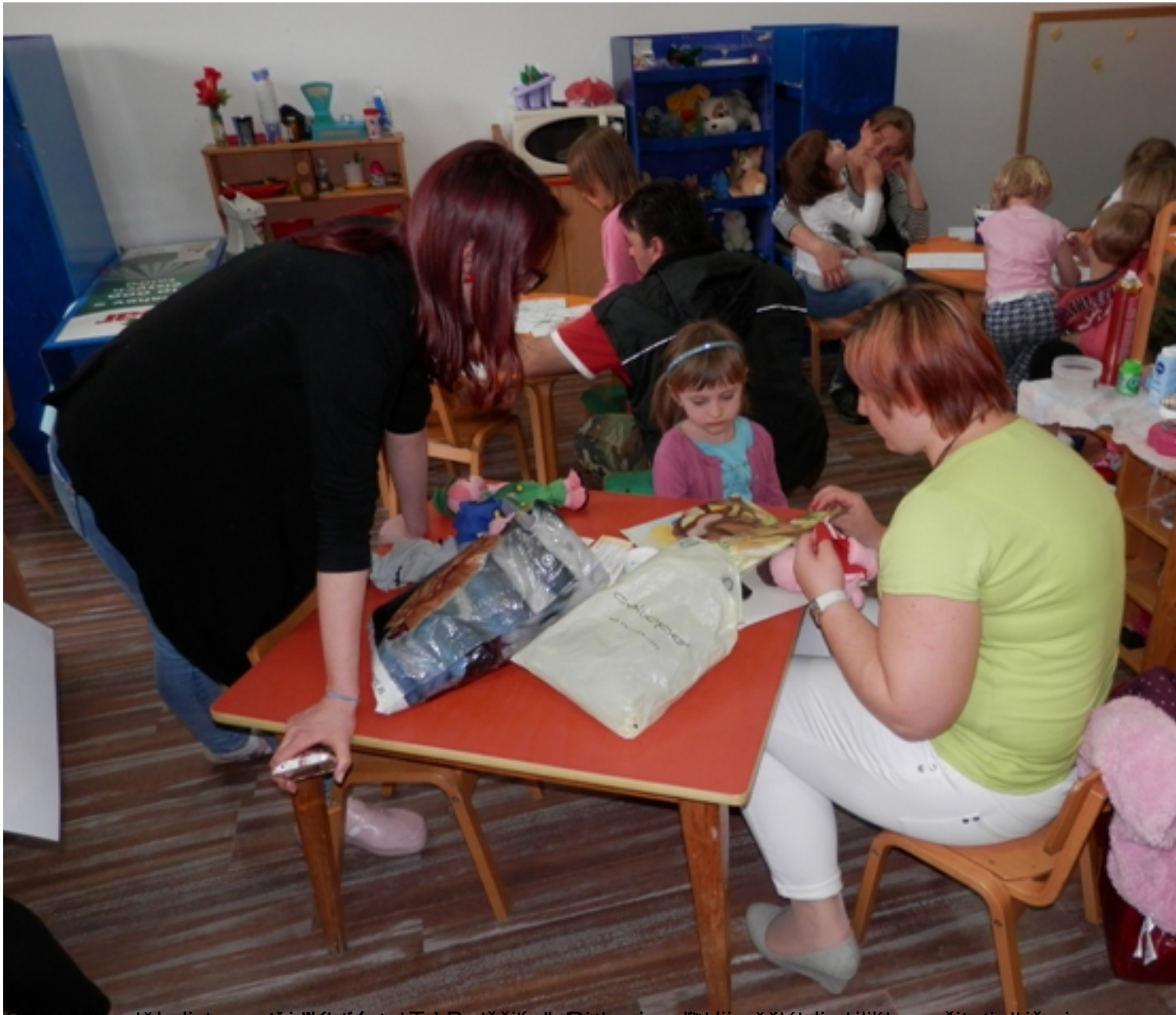
Škola za priču i knjige u vrtiću. Učenici i nastavnici su se zajedno bavili čitanjem i izradom priča iz knjiga. Na slici se vidi kako se djeca i nastavnici bave čitanjem i izradom priča iz knjiga.