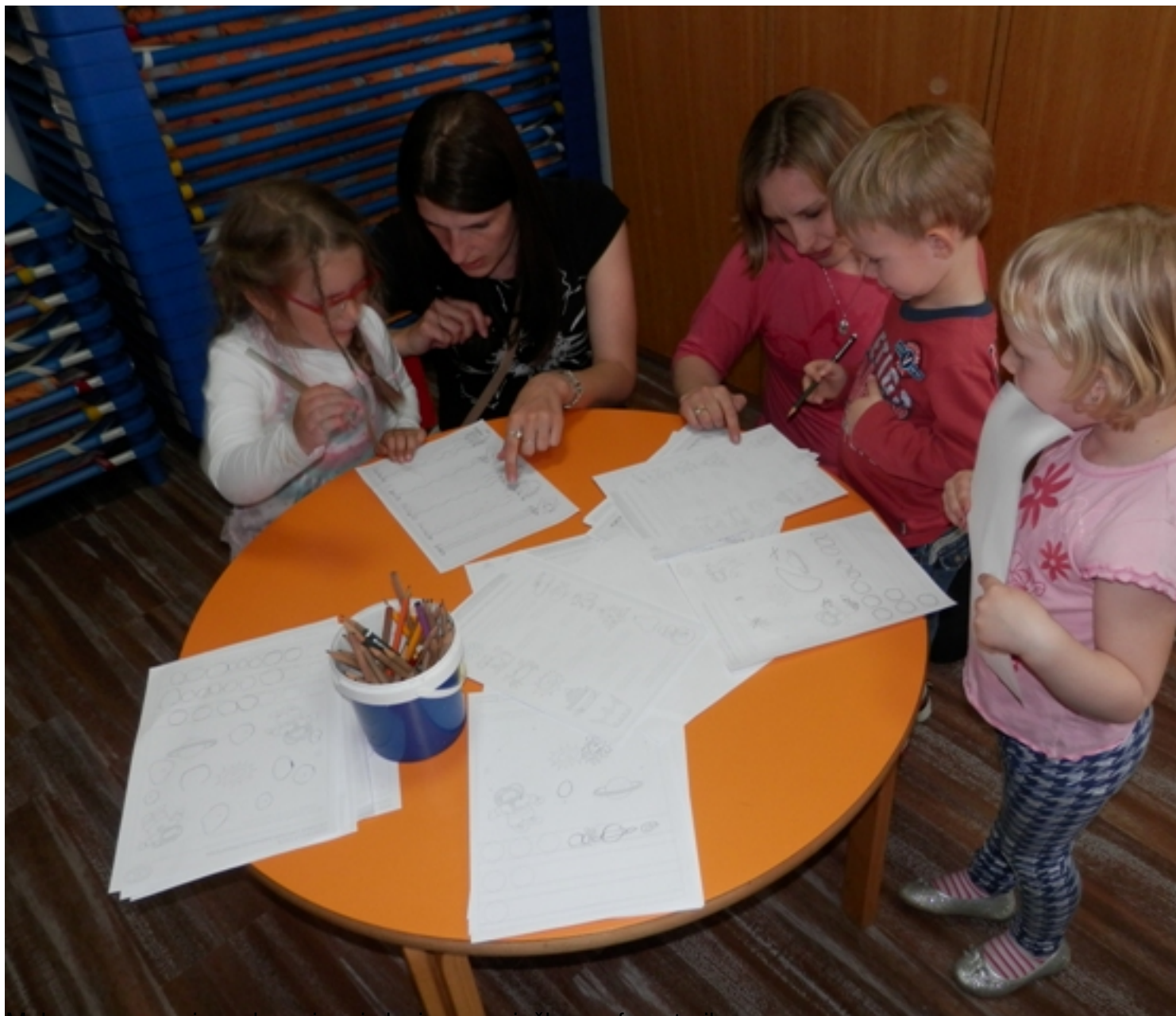
matlo upoznavanja s glasovima i slovima uz vježbe grafomotorike.