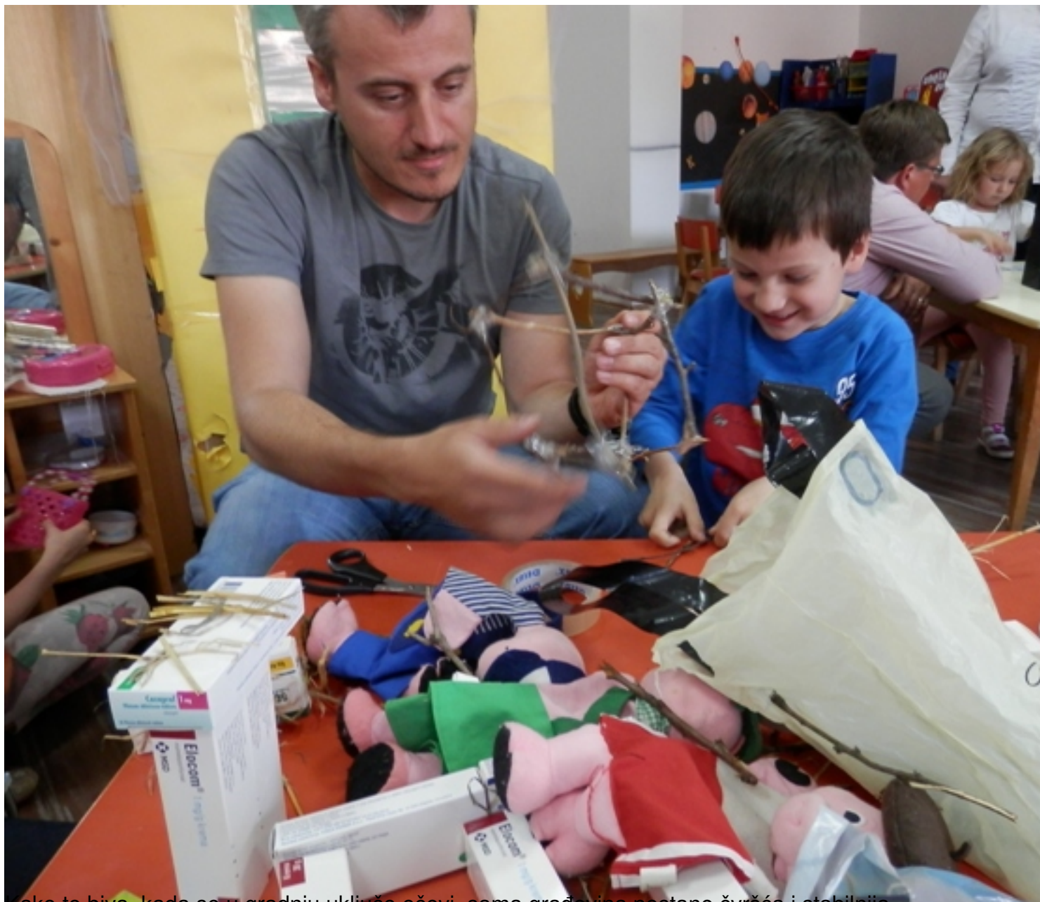
kako to biva, kada se u gradnju uključe očevi, sama građevina postane čvršća i stabilnija.