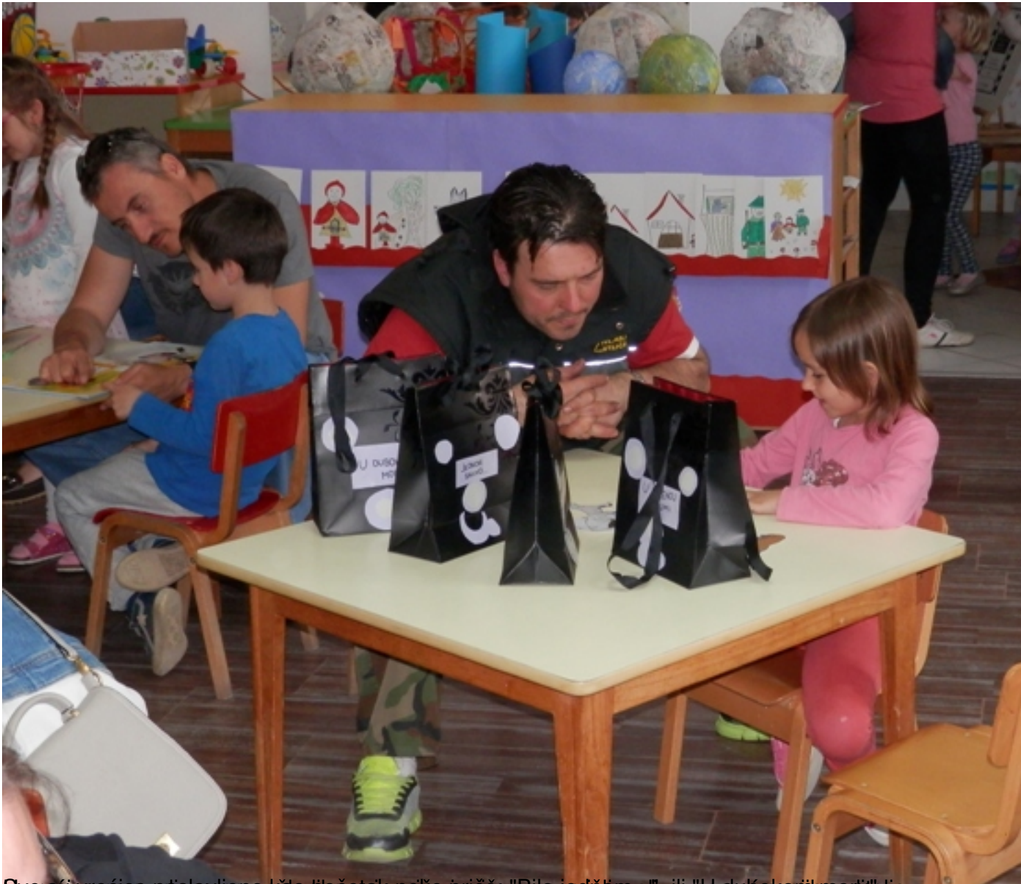
Svećenik i sunčica priprema poklone i peke pred "Dulom" i šaljiva, uz pomoć svojih roditelja.