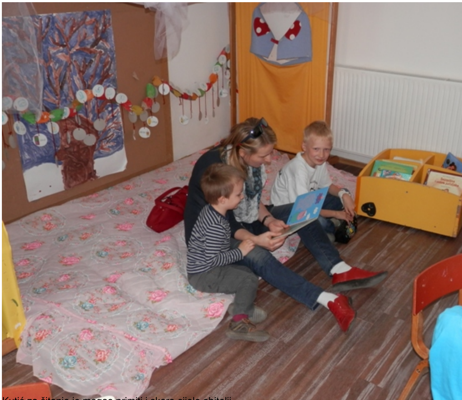
Kutić za čitanje je mogao primiti i skoro cijele obitelji.