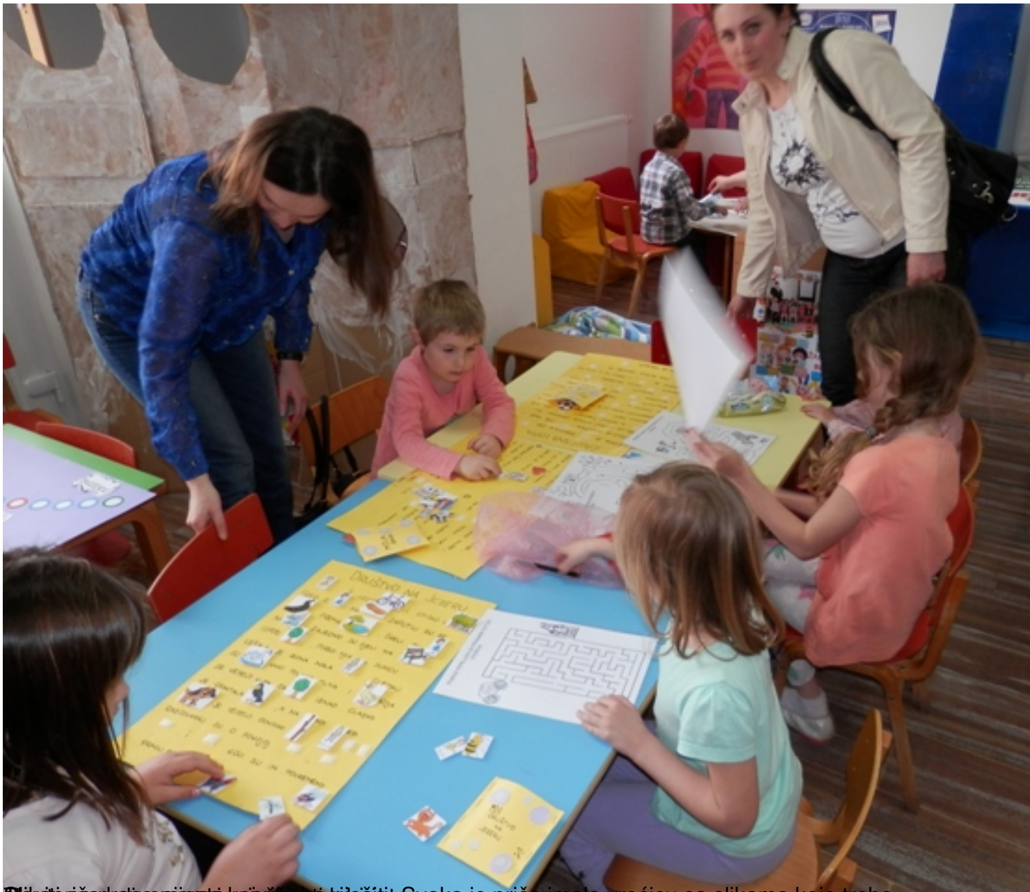
Slike priča i vrtićari su ih kopirali i složili u vrećice. Svaka je priča imala vrećicu sa slikama koje treba