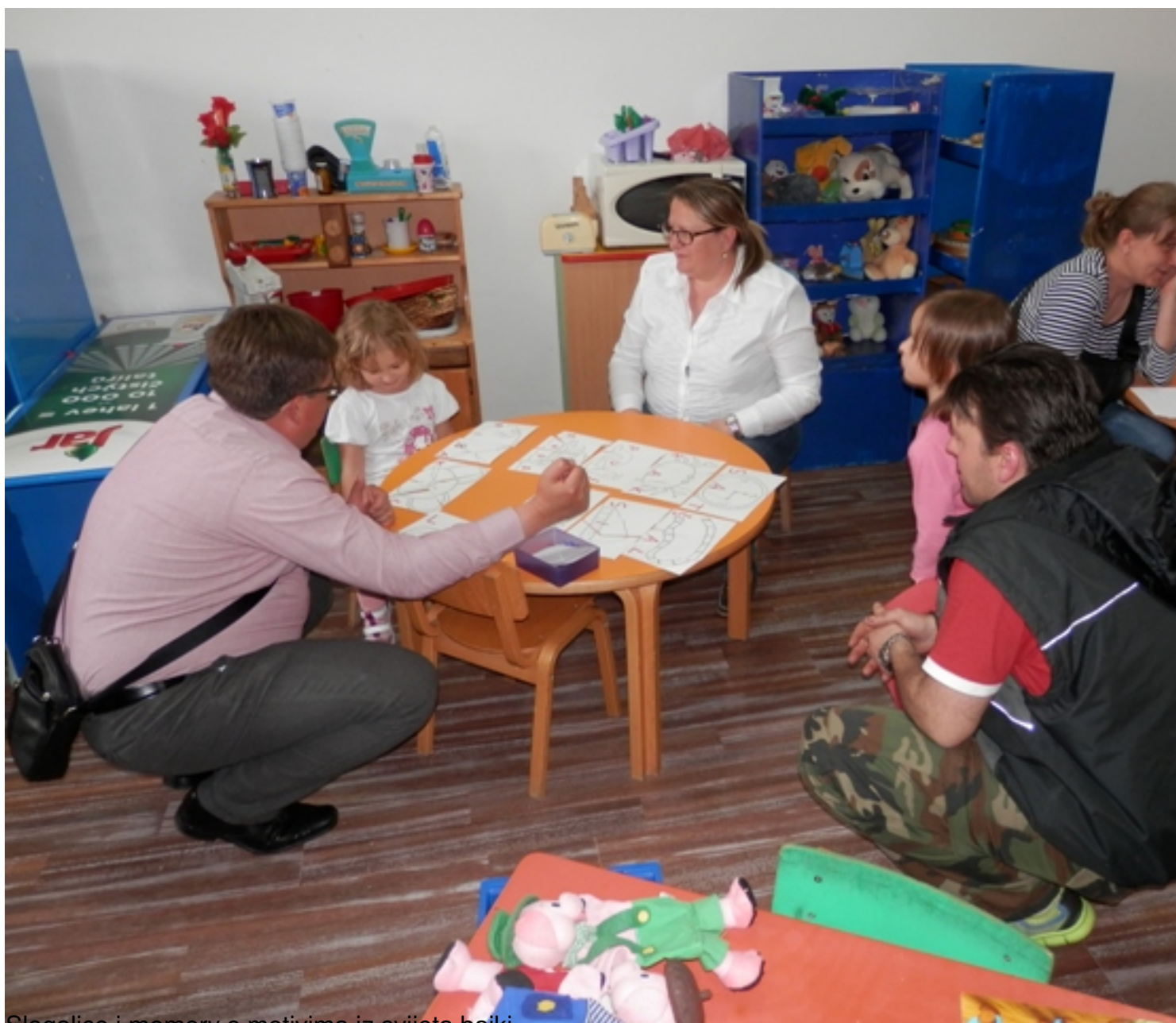
Slagalice i memory s motivima iz svijeta bajki.