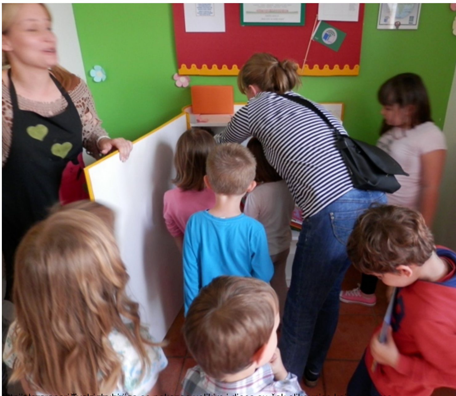
Učiteljica za posuđivanje knjiga se pokazao velikim i djeca su čak slikovnice koje su sama