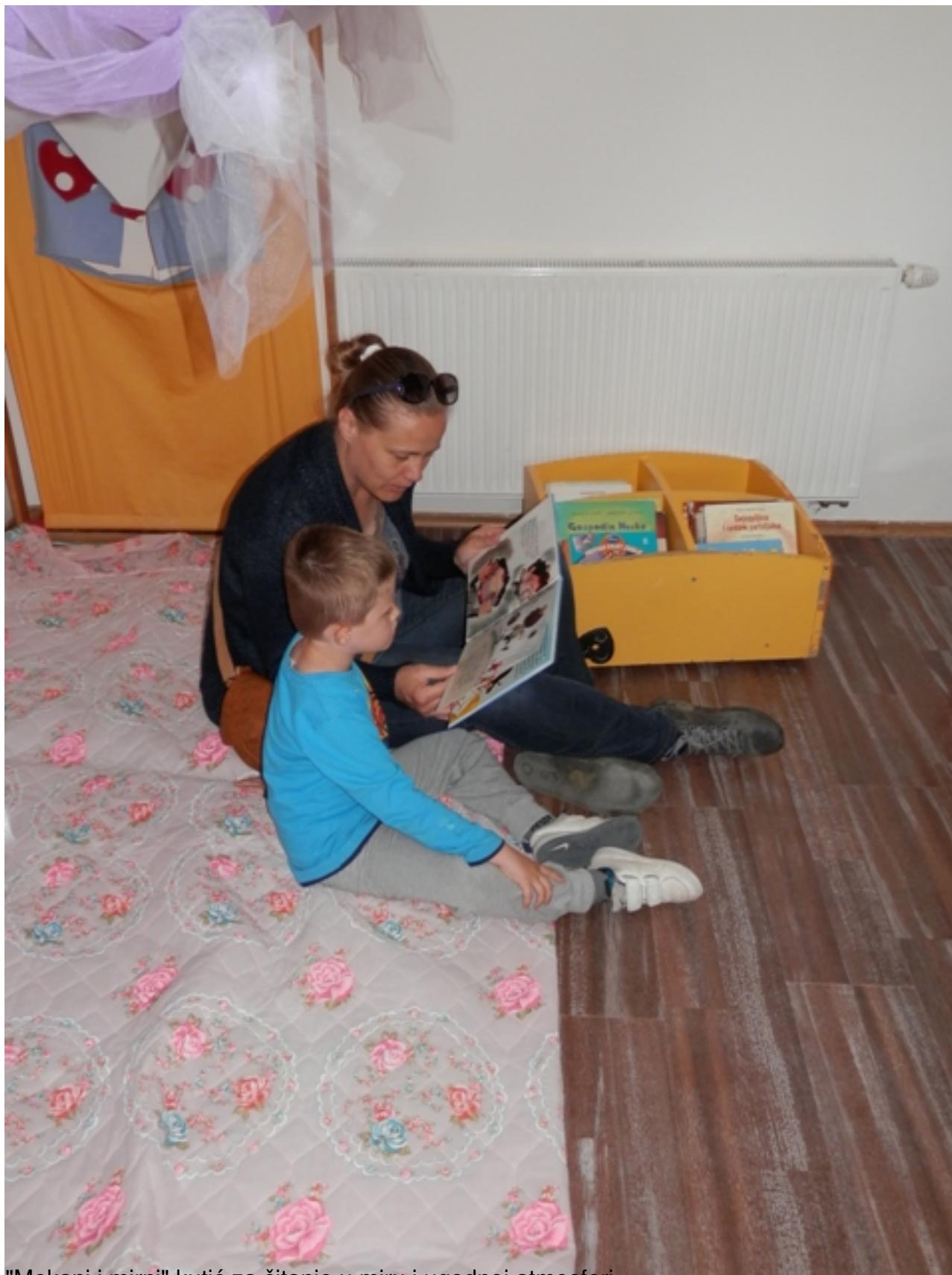
"Mekani i mirni" kutić za čitanje u miru i ugodnoj atmosferi.