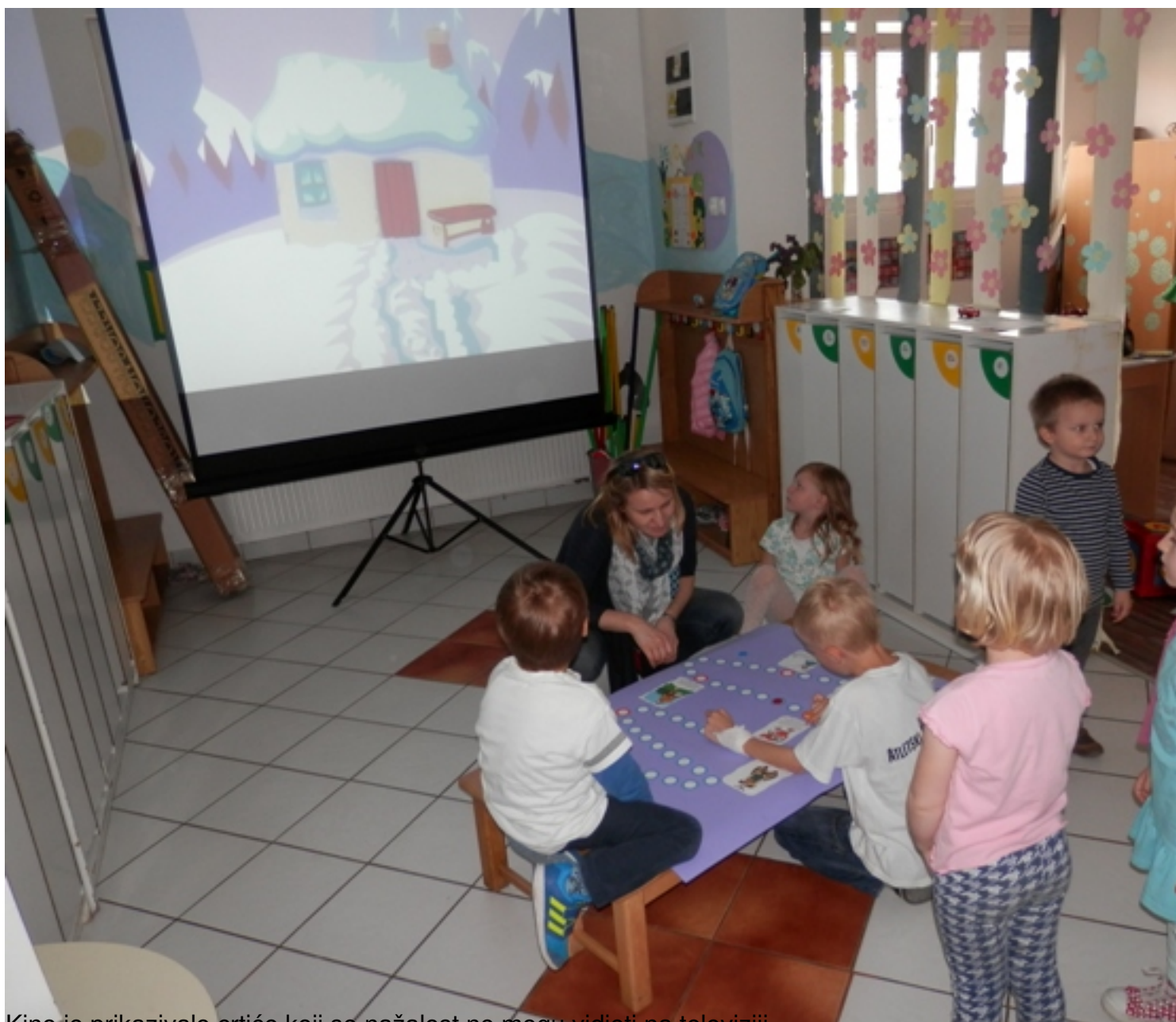
Kino je prikazivalo crtiće koji se nažalost ne mogu vidjeti na televiziji.