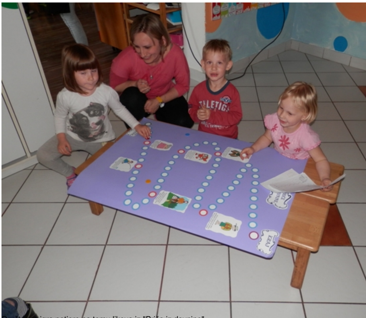
Društvena igra potjere na temu likova iz "Priča iz davnine".