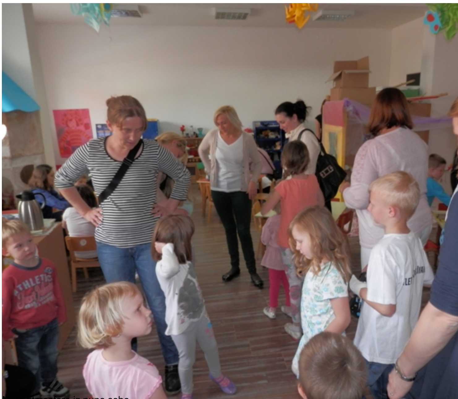
imalo atmosfere iz pune sobe.