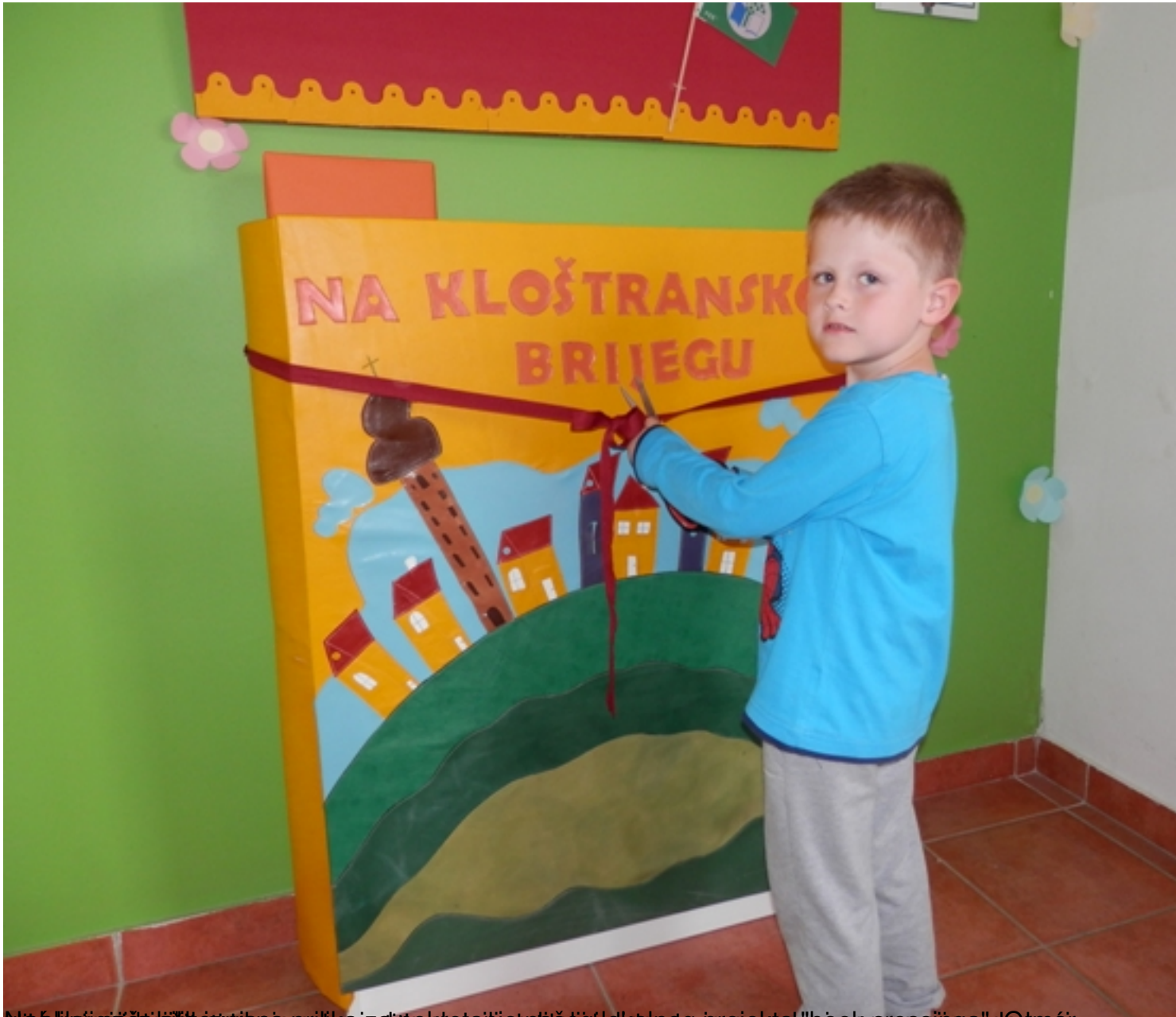
Stožić, M. (2019). Noć knjige u našem vrtiću. U: M. Stojanović (ur.), Projekat "Zoo pravoslijepa" dečakir