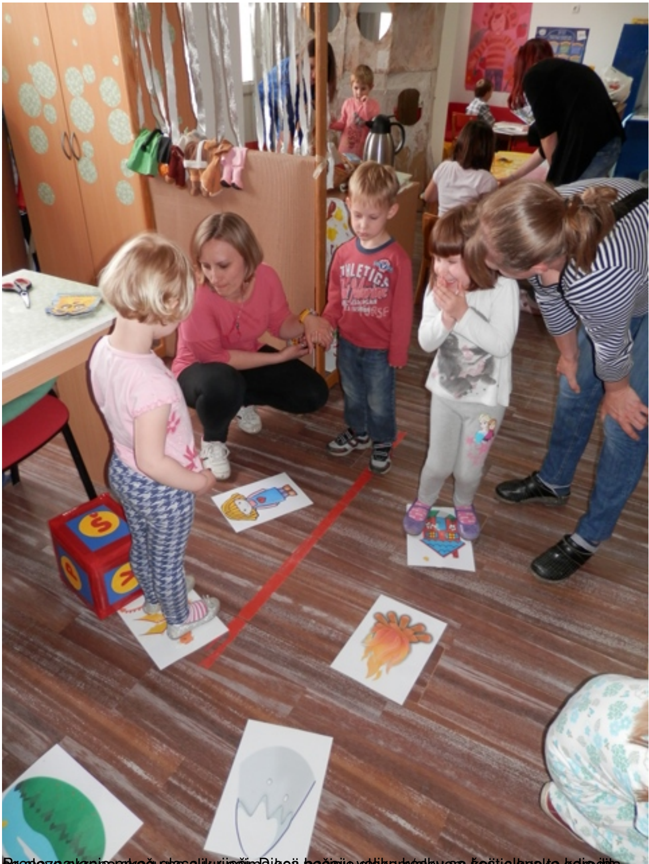
Bez pozdrava je prva igra u kojoj pomaže vrtićki dječaci i djevojčice da se upoznaju i nauče da se igraju zajedno.