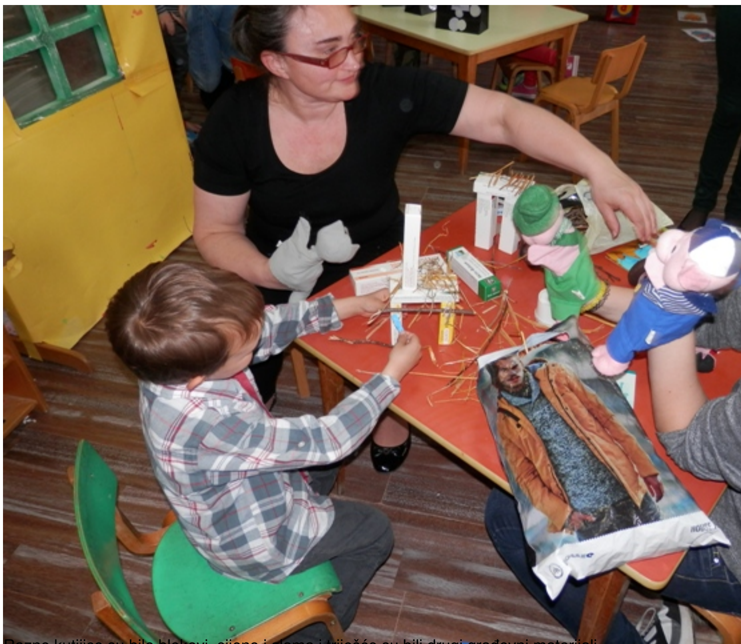
Razne kutijice su bile blokovi, sijeno i slama i triješće su bili drugi građevni materijali.