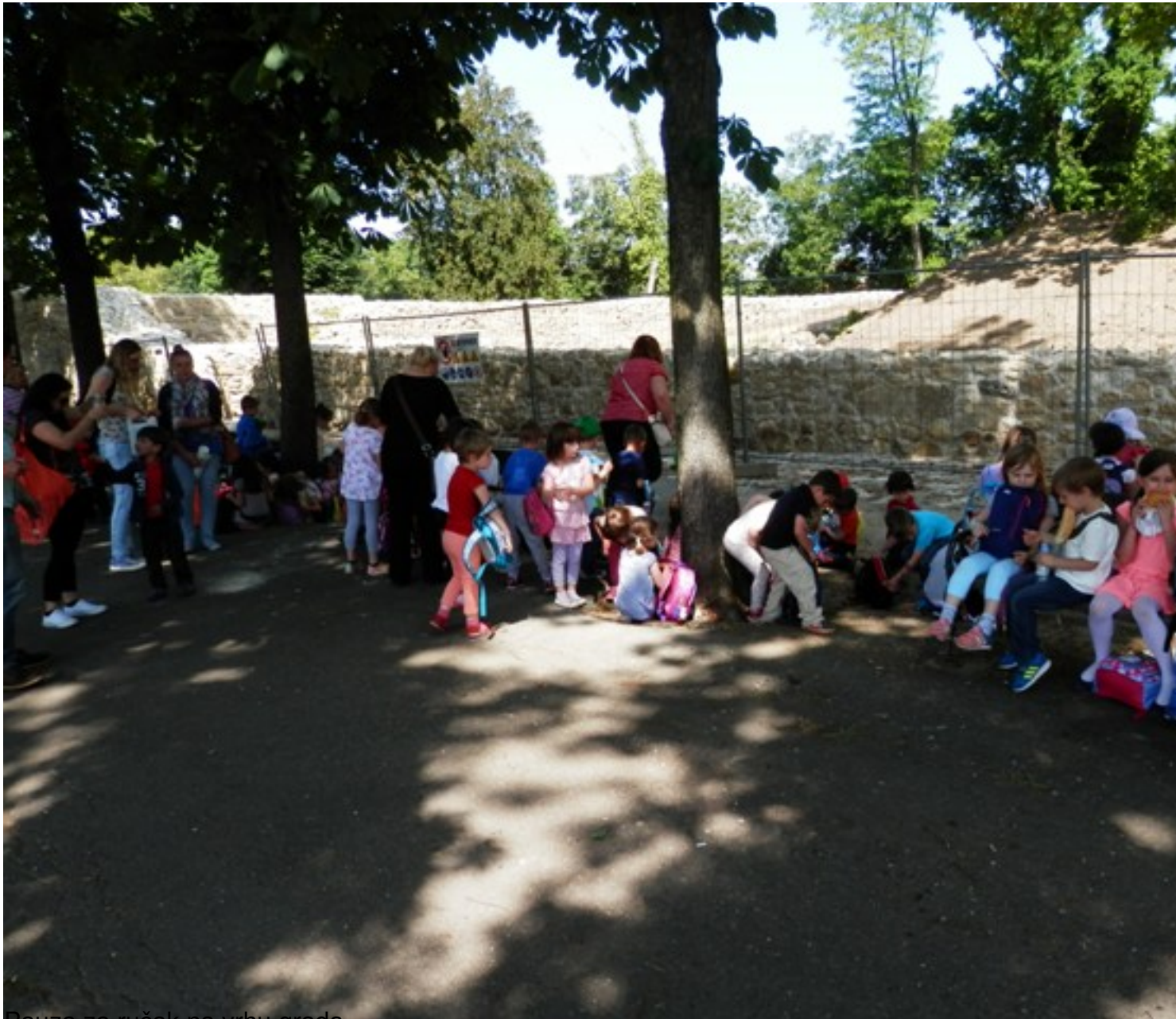
Pauza za ručak na vrhu grada.