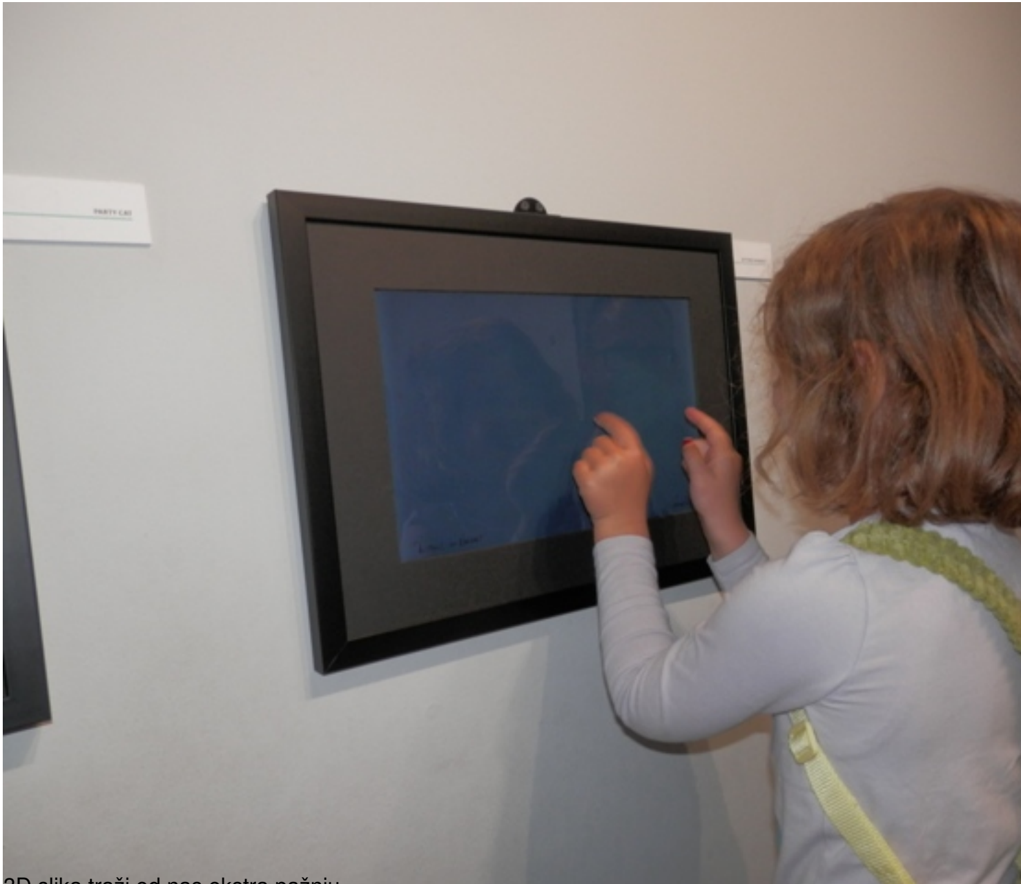
3D slika traži od nas ekstra pažnju.