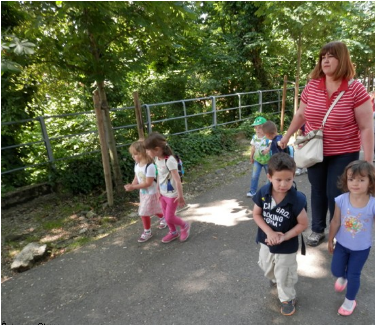
Šetnja po Strossu.