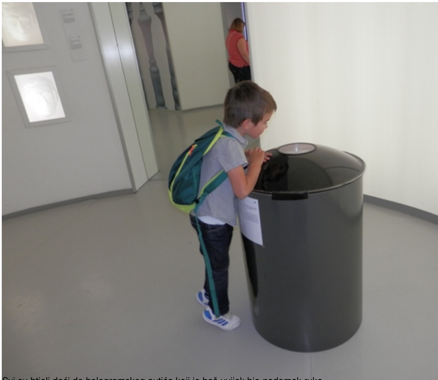
Svi su htjeli doći do hologramskog autića koji je baš uvijek bio nadomak ruke.