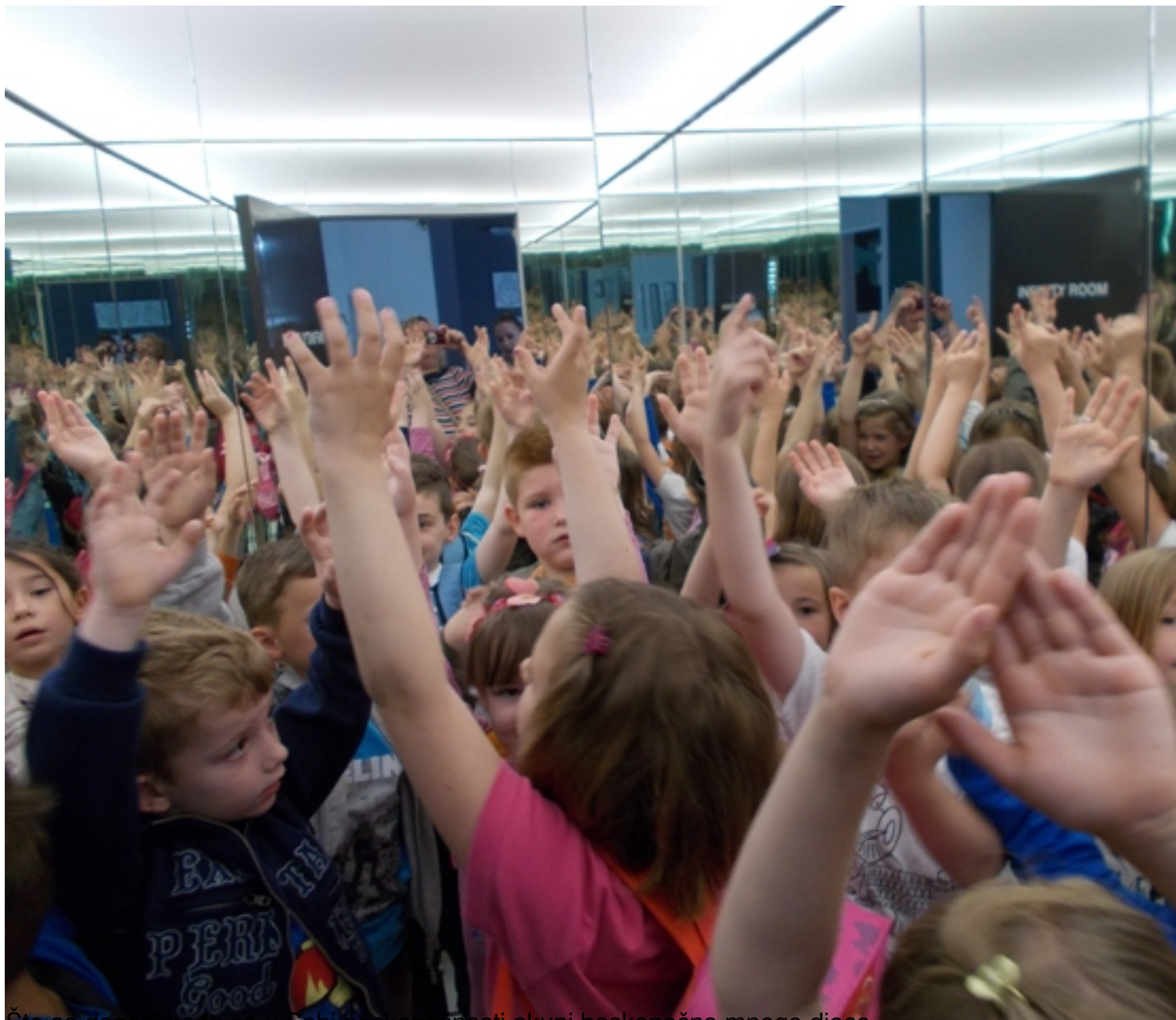
Što se dogodi kada se u Sobi beskonačnosti okupi beskonačno mnogo djece.