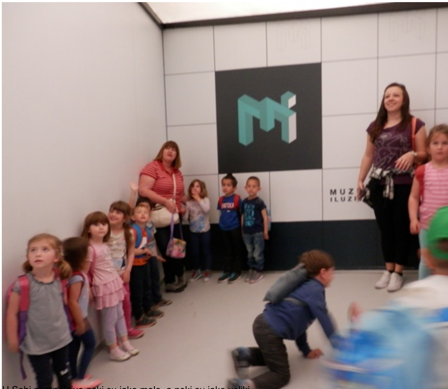
U Sobi perspektive neki su jako malo, a neki su jako veliki.