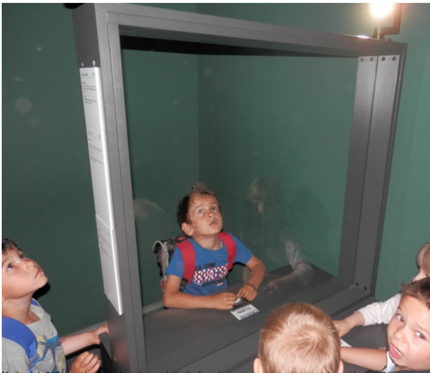
Kao se ulazite ispod stroboskopskog svjetla ljudi preko puta vas se pojave pred vas i izgledaju kao senke!