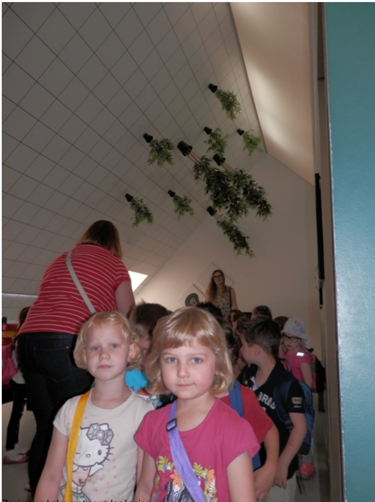
Zanimljivo kako rastu ove lončanice.