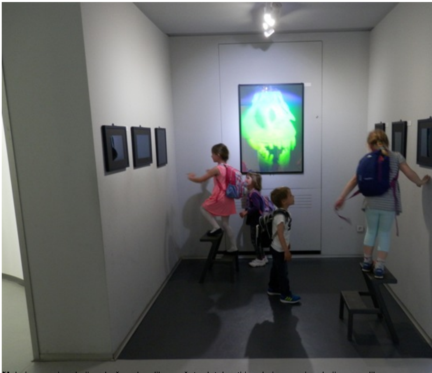
Malo je muzeja u kojima baš svaku sliku možete dotaknuti i malo je muzeja u kojima su slike