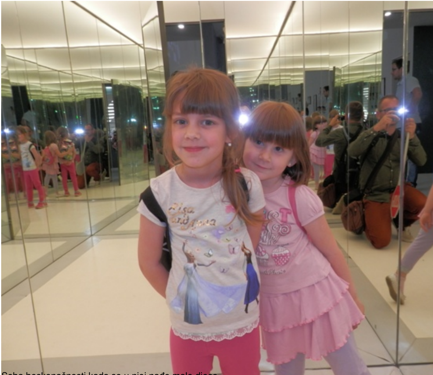
Soba beskonačnosti kada se u njoj nađe malo djece.