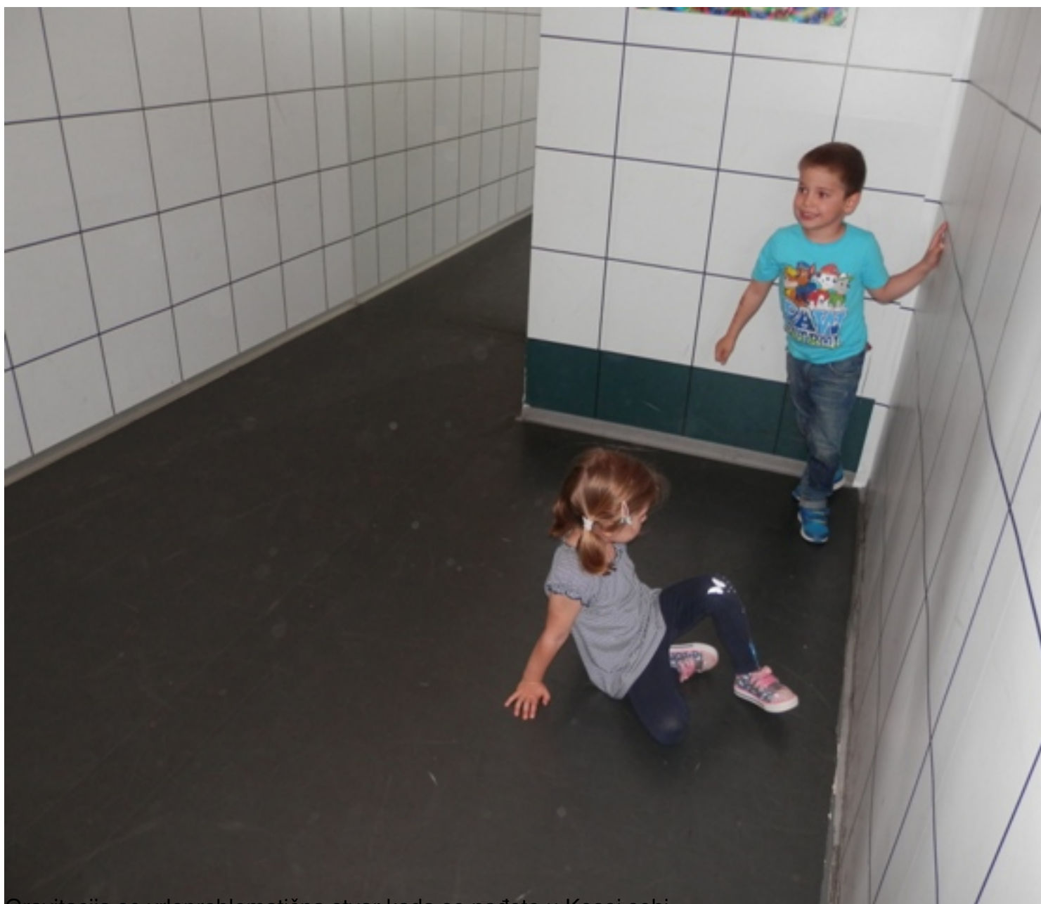
Gravitacija se vrlo problematična stvar kada se nađete u Kosoj sobi.