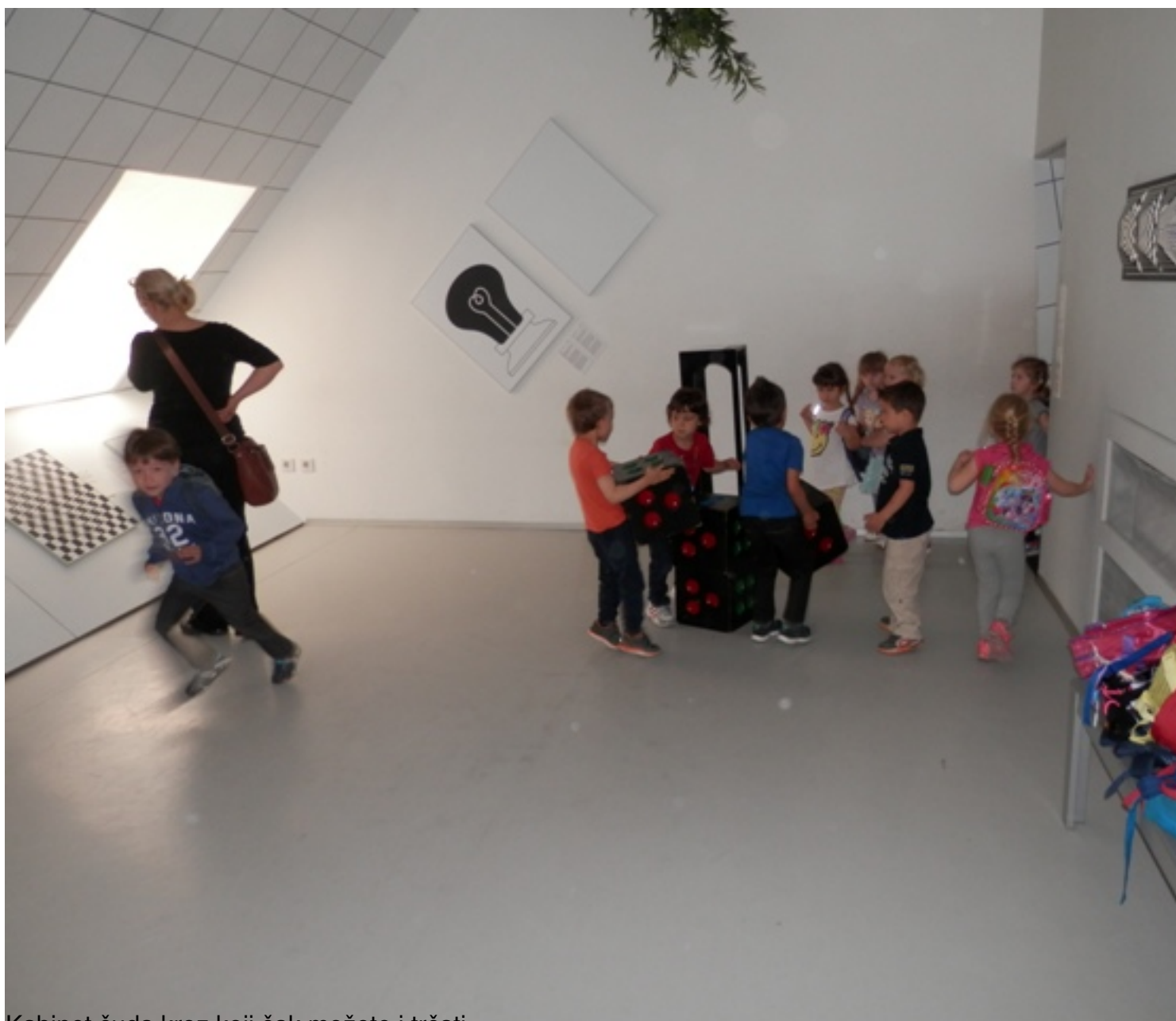
Kabinet čuda kroz koji čak možete i trčati.