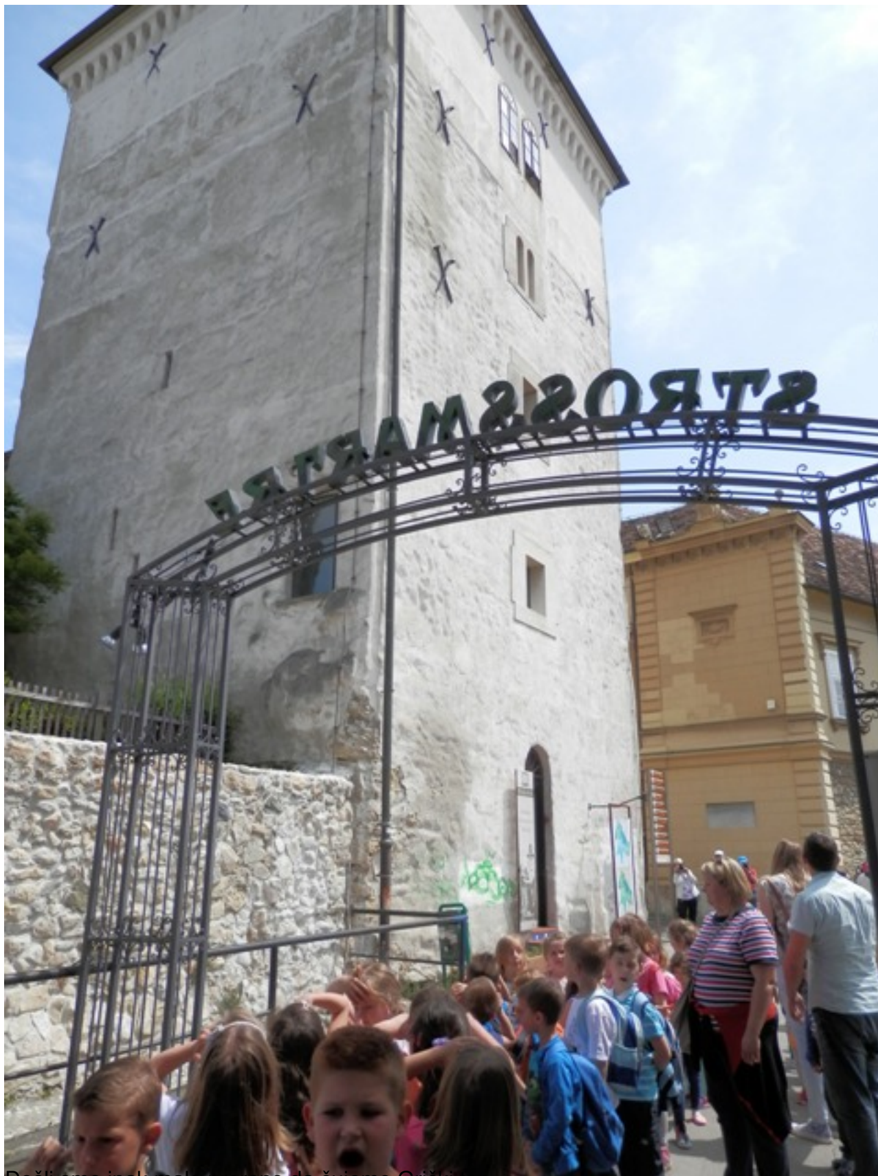
Došli smo ipak malo prerano da čujemo Grički top.