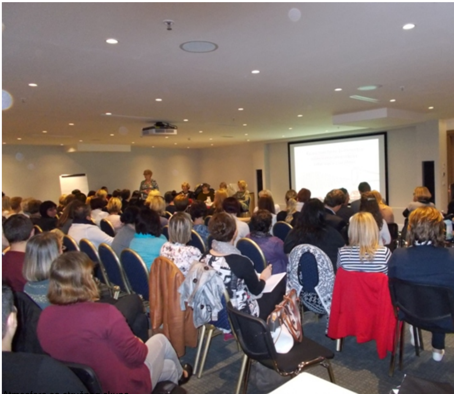
Atmosfera sa stručnog skupa.