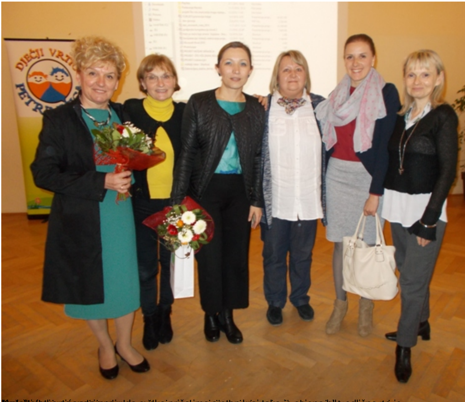
Naslovna strana časopisa "Dječji vrtić Petrinja" - sva prava zadržana. Slike su iz privatne arhive organizacije. Slike su iz privatne arhive organizacije. Slike su iz privatne arhive organizacije.