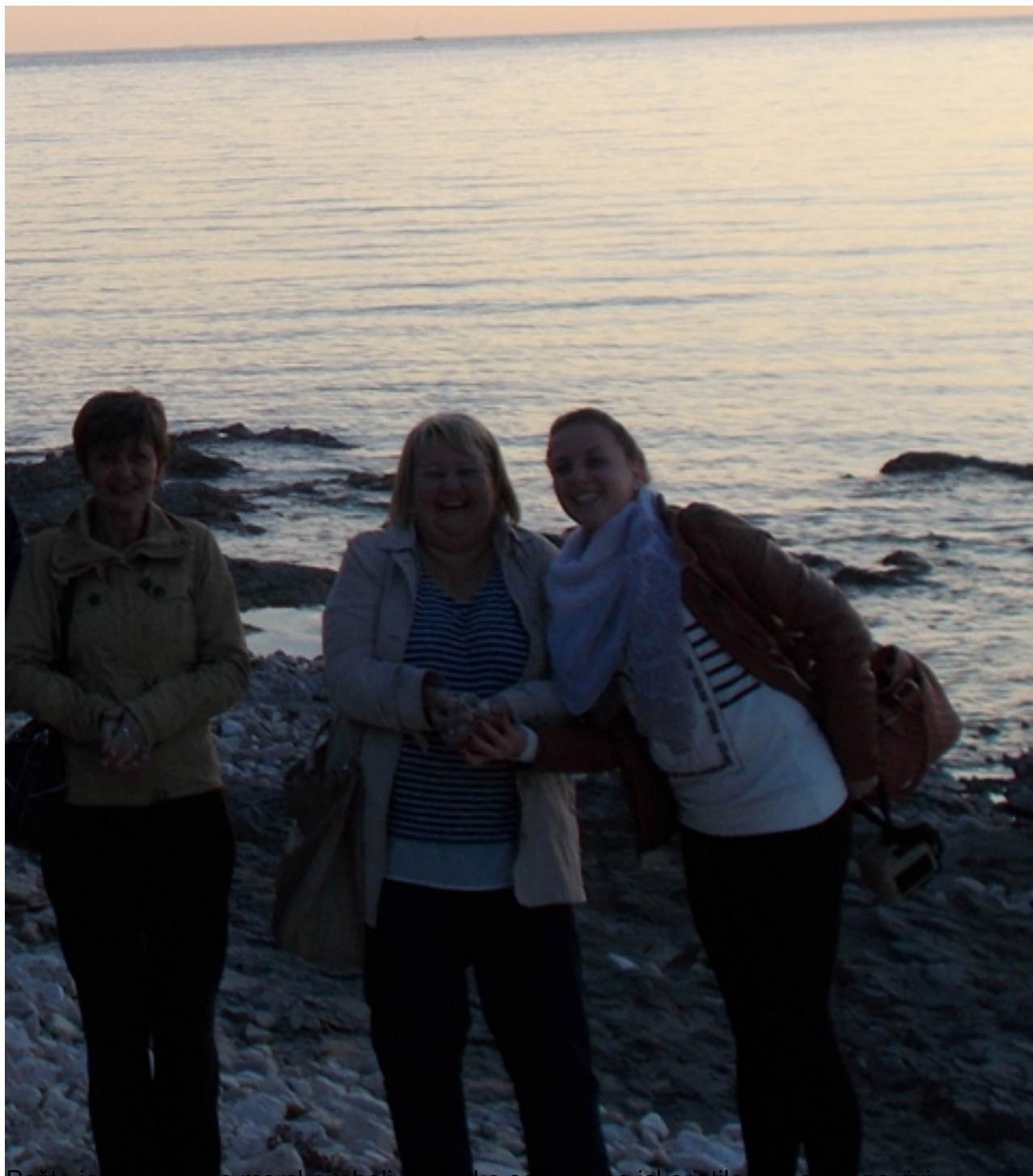
Pošto je meduin na morskoj obali, trenutke odmora se iskoristilo za setnju po rivi.