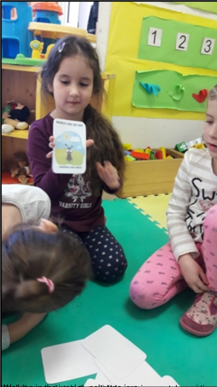
Na sliku in na čisto glade potrežeta igra, rajmuna, tukana i tigra