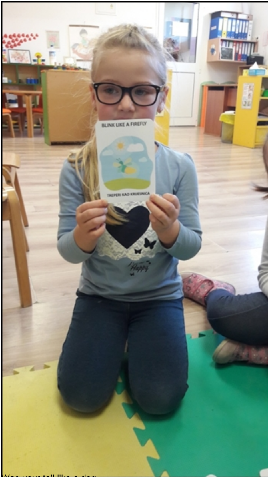
Wag your tail like a dog