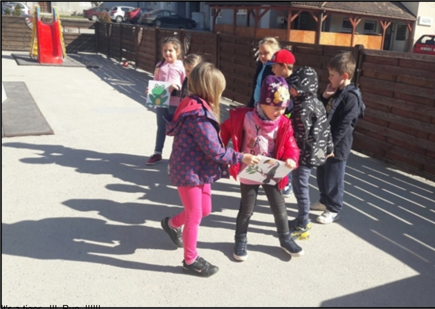
It's a tiger !!! Run !!!!!