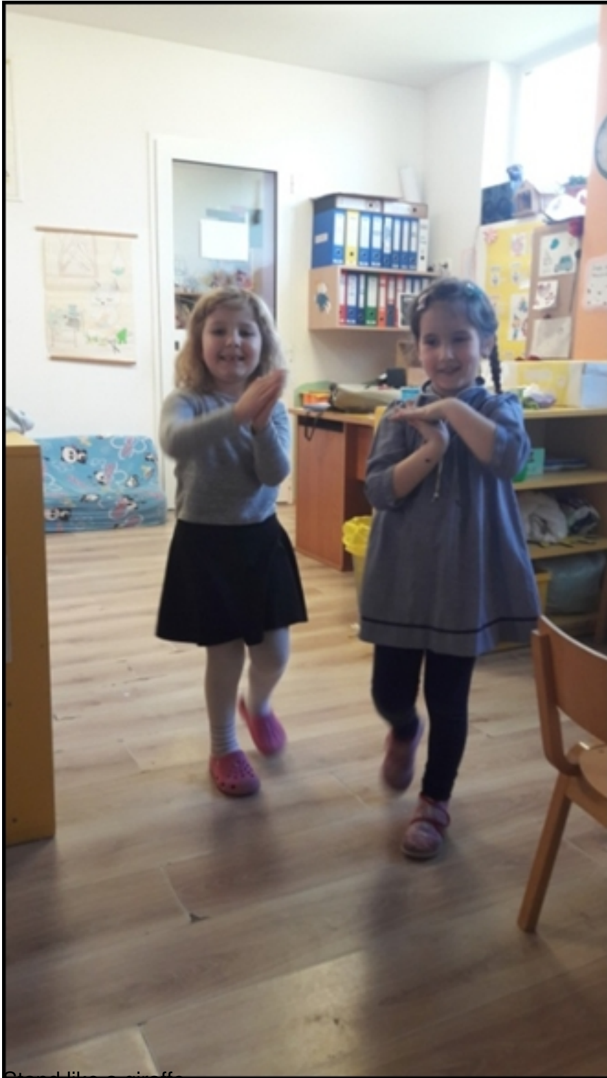
Stand like a giraffe