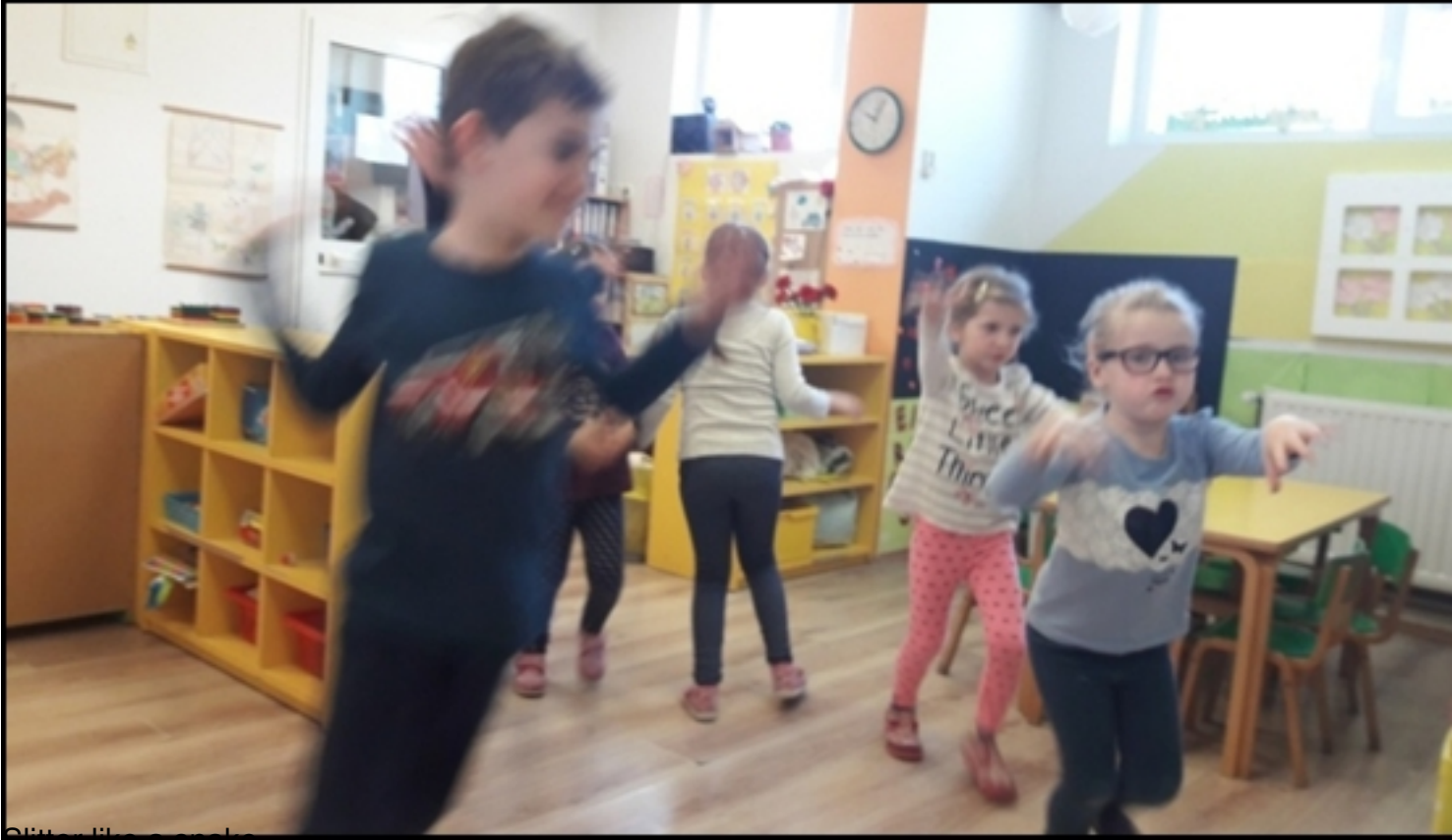
Slither like a snake