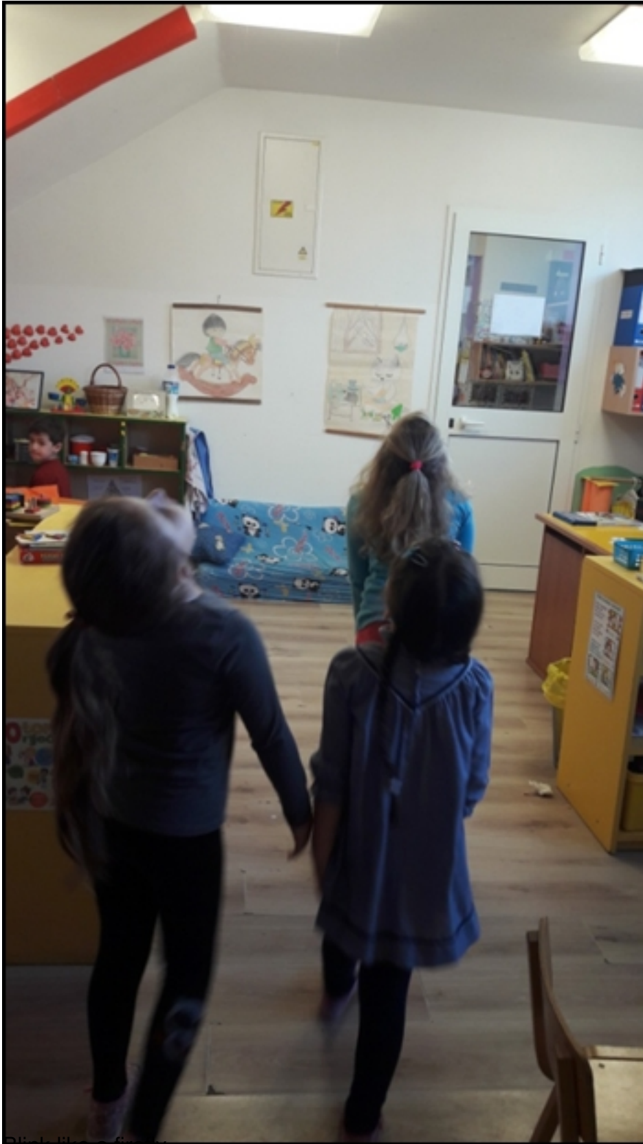
Blink like a firefly