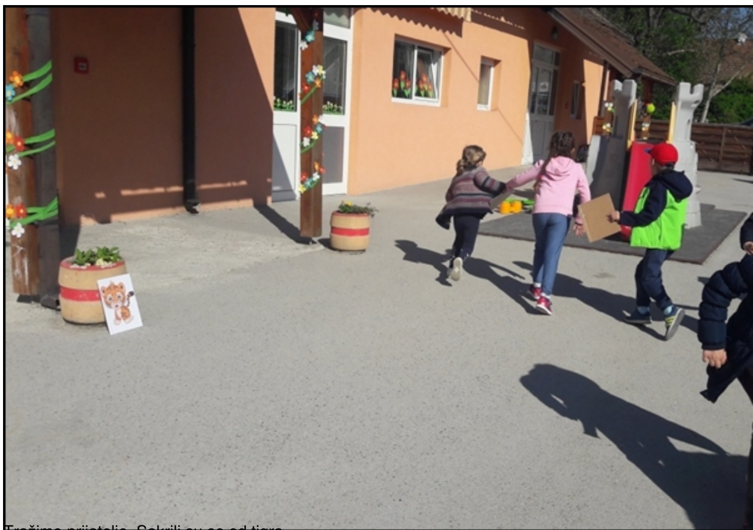
Fražimo prijatelje. Sakrili su se od tigra...