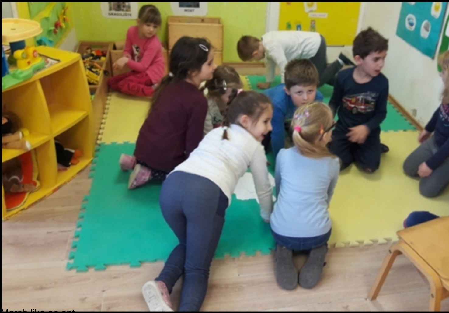
March like an ant