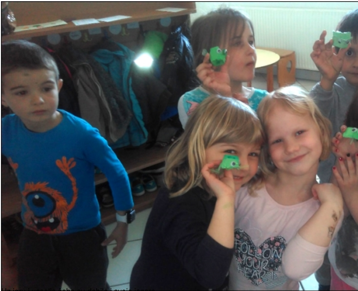
Uz igru i veselje žabe su dobile i svoje jezero.