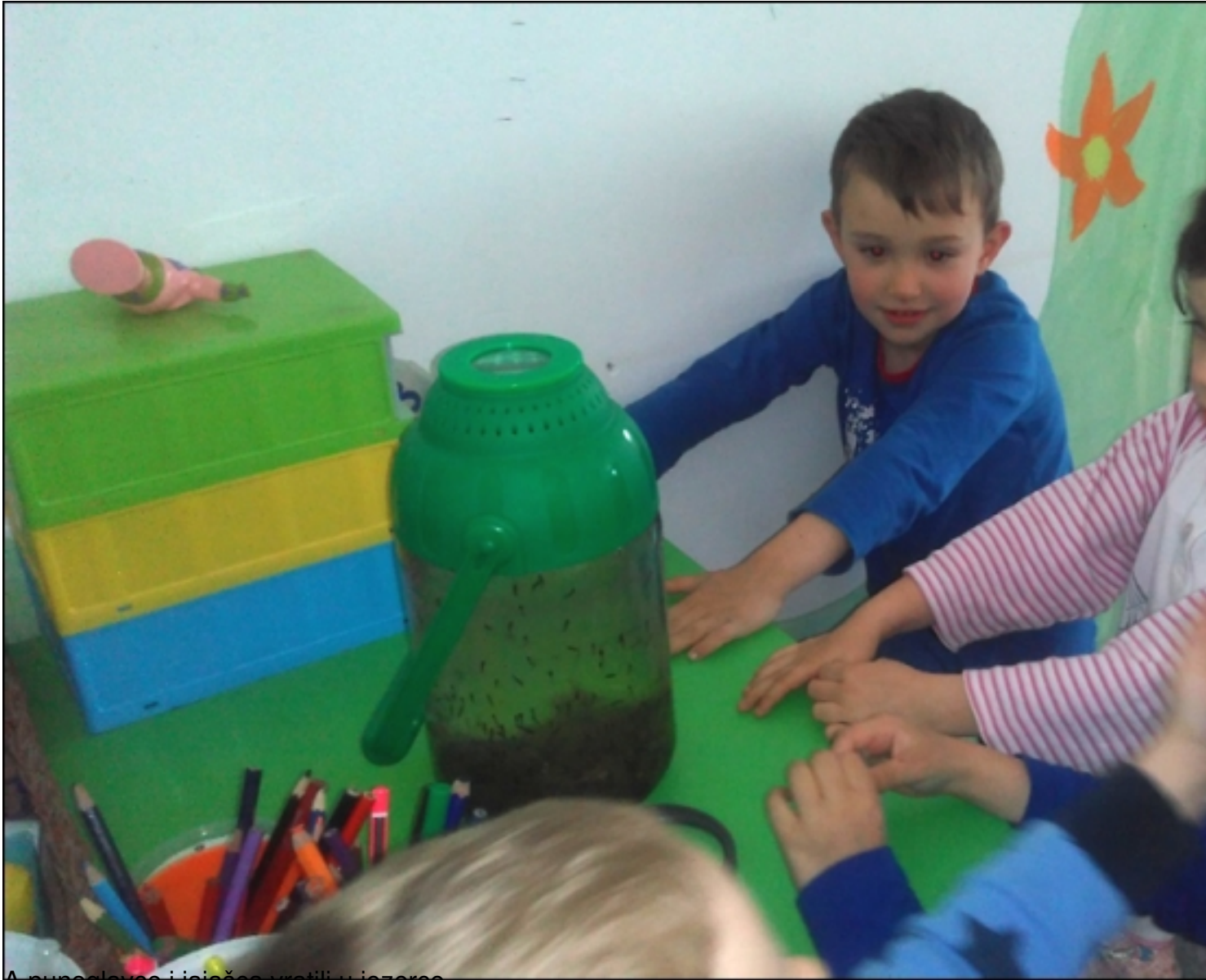
A punoglavce i jajašca vratili u jezerce.