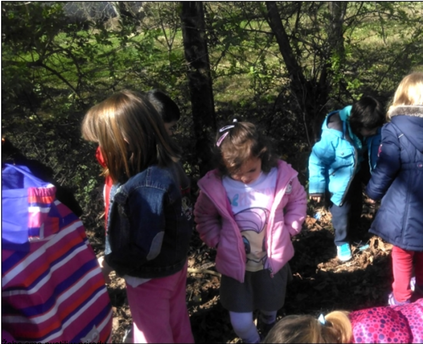
Žabe smo pustili u prirodu